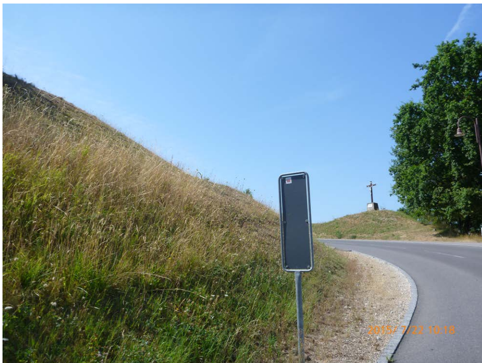
Photos de l'objet 22.07.2015